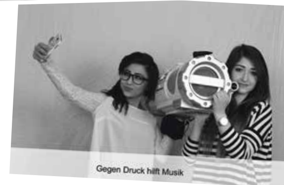
Gegen Druck hilft Musik