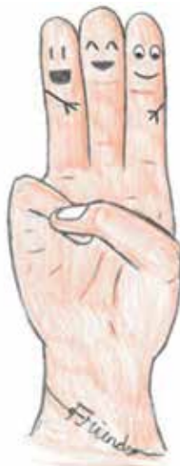
Illustration von Can, Jugendlicher