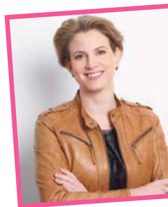
NEOS Spitzenkandidatin Beate Meinel-Reisinger

Wir benötigen mehr direkte Demokratie und mehr Mitbestimmungsmöglichkeiten, um die Jungen für die politische Teilhabe wieder zu begeistern. Volksbefragungen mit durchschaubaren Fragestellungen tragen jedenfalls nichts Positives dazu bei. Die ÖVP Wien hat ein Demokratiepaket vorgelegt, um hier eine Änderung zu bewirken.