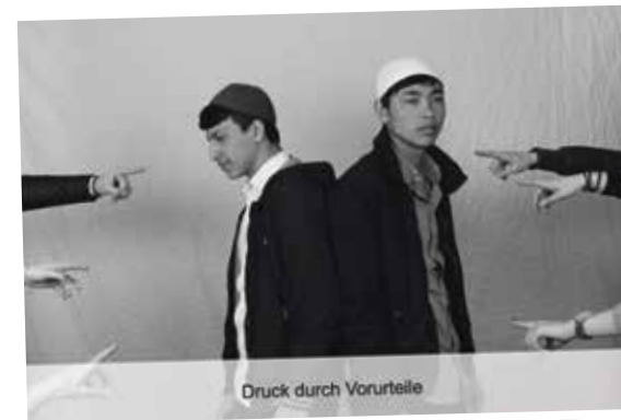
Druck durch Vorurteile

Der wienXtra-Jahresschwerpunkt 2015, „Jugend und Druck“ widmet sich den Lebenswelten und Zukunftsperspektiven junger Menschen und wird in Kooperation mit dem MA-13-Fachbereich Jugend umgesetzt.