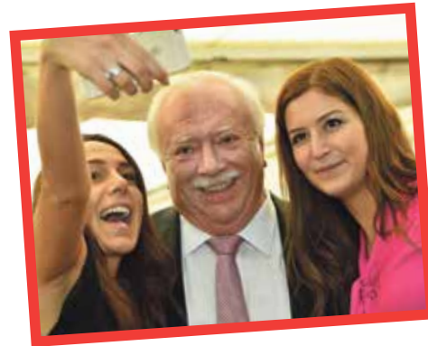
SPÖ Spitzenkandidat Michael Häupl

so auf ihre politische Mitsprache. MeinungsforscherInnen sprechen von Politik- oder PolitikerInnenverdrossenheit. Im Mittelpunkt der politischen Berichterstattung stehen meist Skandale oder parteipolitische Streitigkeiten. Das führt zu Frustration. Undurchschaubar sind für viele die politische Programme und Vorstellungen der handelnden PolitikerInnen. Aus diesem Grund haben wir die SpitzenkandidatInnen der im Landtag und Gemeinderat vertretenen Parteien (SPÖ, FPÖ, Grüne und ÖVP) um ihre Meinung zu spezifischen Themen gefragt. Die gleichen Fragen, haben wir auch an die Spitzenkandidatin der Neos gerichtet. Unsere Fragen wurden von allen Parteien, außer den Grünen, beantwortet. Dafür ein herzliches Dankeschön.