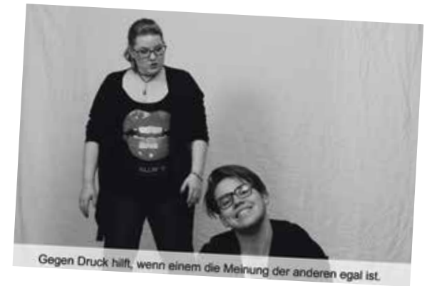
Gegen Druck hilft, wenn einem die Meinung der anderen egal ist.

Alles ist möglich, aber was ist sicher? Der Beruf? Dieser Lebensweg? Die eine Beziehung? Welche Zukunft schafft Sicherheiten? Was kann die neoliberale Gesellschaft bieten? Welche Kompetenzen braucht es bei so viel Multioptionalität? Wirtschaftlicher Druck nimmt zu, eindimensionale Lebenswege waren gestern.