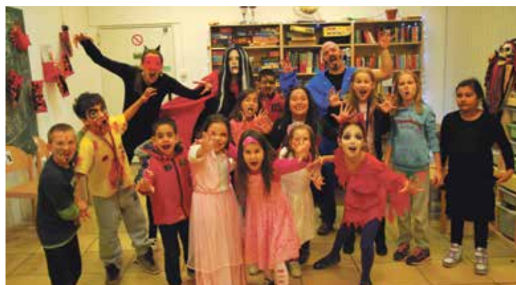
... die Kids, die tagtäglich zu uns kommen, sind die größte Belohnung dafür.