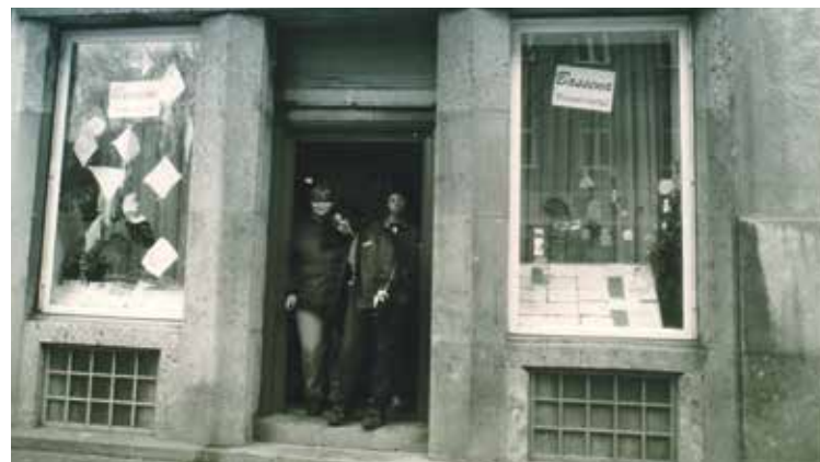
Vor 20 Jahren haben wir unter sehr einfachen Verhältnissen begonnen ...

Dass wir so weitermachen können, wie bisher. Mit genau so viel Unterstützung wie bisher. Dass die Kids gerne zu uns kommen, viel Spaß haben und sich später gerne an die Bassena Stuwerviertel erinnern. ■